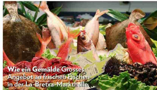
Wie ein Gemälde Grosses Angebot an frischen Fischen in der La-Bretxa-Markthalle.