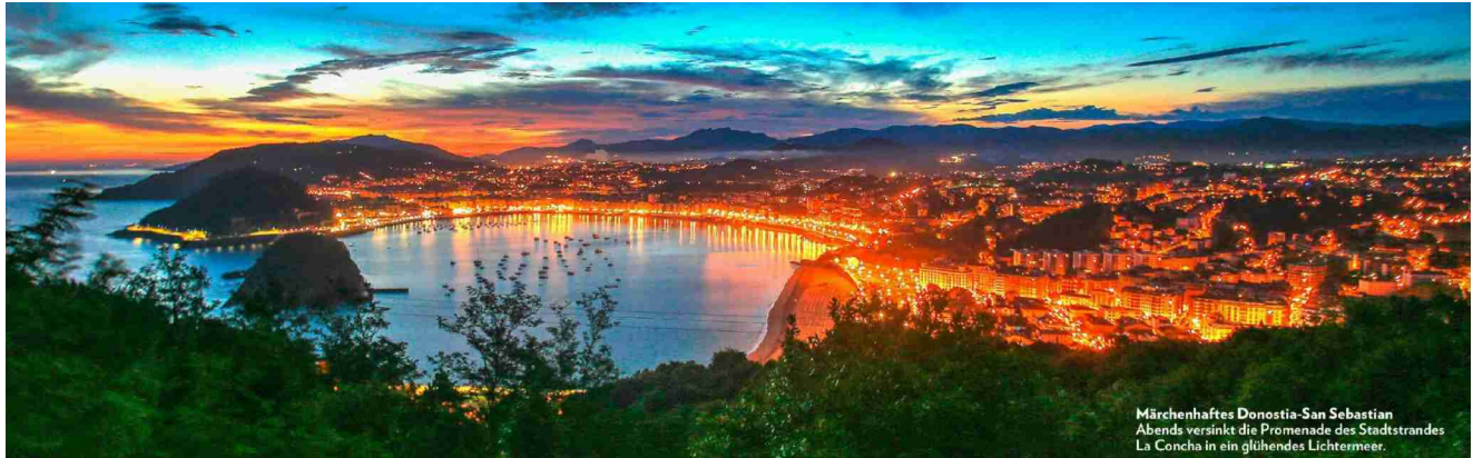
Märchenhaftes Donostia-San Sebastian Abends versinkt die Promenade des Stadtstrandes La Concha in ein glühendes Lichtermeer.

Abo-Nr.: 868007 Seite: 68 Fläche: 82 585 mm 2 AEV (in Tsd. CHF): 44,0