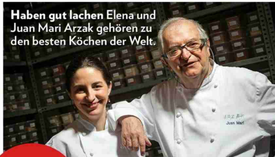
Haben gut lachen Elena und Juan Mari Arzak gehören zu den besten Köchen der Welt.